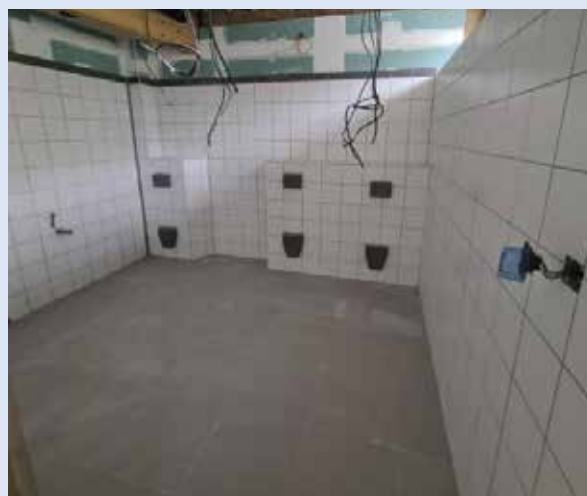
Novembre 2022 : avancement sur la réalisation de la faïence par l'entreprise MIRIEL Fin 2022 : mise en place de l'ensemble du placoplâtre par l'entreprise BIDAULT