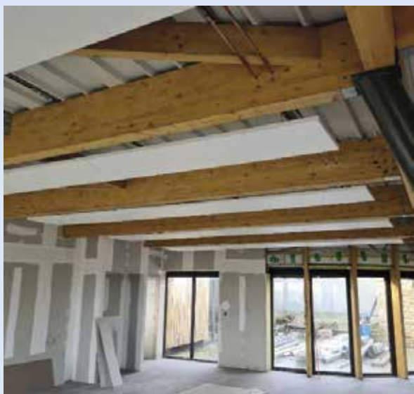
Octobre 2022 : Mise en place de la géothermie avec panneaux radiants par l'entreprise EREO