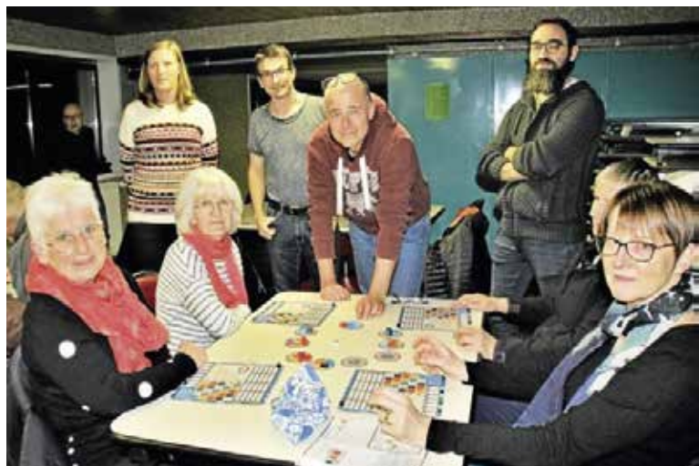
Jeu dit on joue au Foeil : Soirée jeux de société adultes et ados ouvert à tous