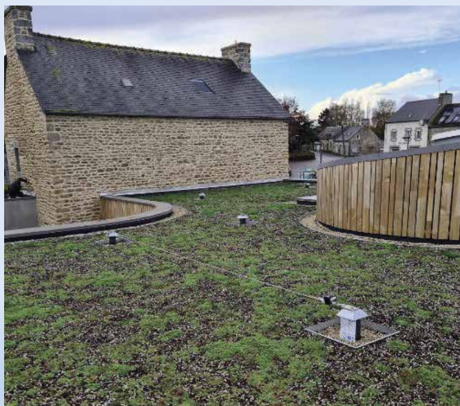
Juillet 2022 : Réalisation du toit végétalisé par l'entreprise DENIEL

Mais initialement, ce site du centre bourg avait une tout autre fonction et abritait une forge. C'est en référence à ce passé que le nom « les feuilles forgées » a été choisi pour la médiathèque. Il crée un pont temporel entre les deux usages de ce lieu emblématique du centre bourg et rend hommage aux anciens acteurs de notre commune.