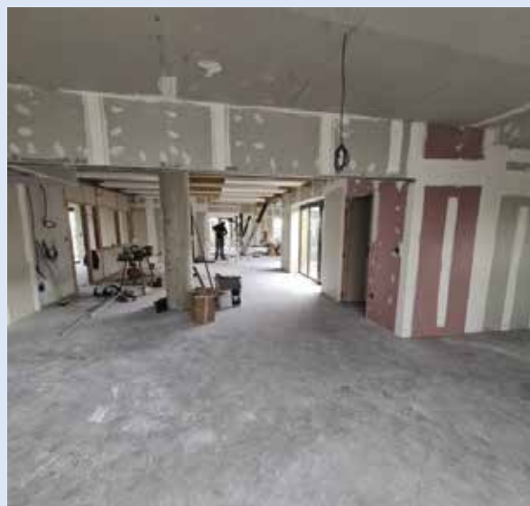
Octobre 2022 : Réalisation de la chape par l'entreprise MIRIEL