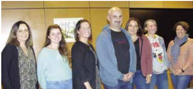
Les membres du bureau de l'amicale laïque.