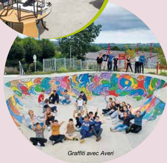
Graffiti avec Averi

créations dans leurs animations. Une sortie au laser game est prévue pour 16 jeunes. Il y aura une moyenne de 22 jeunes par jour pour les vacances d'automne. L'espace jeunes sera ouvert du 21 octobre au 31 octobre 2024.