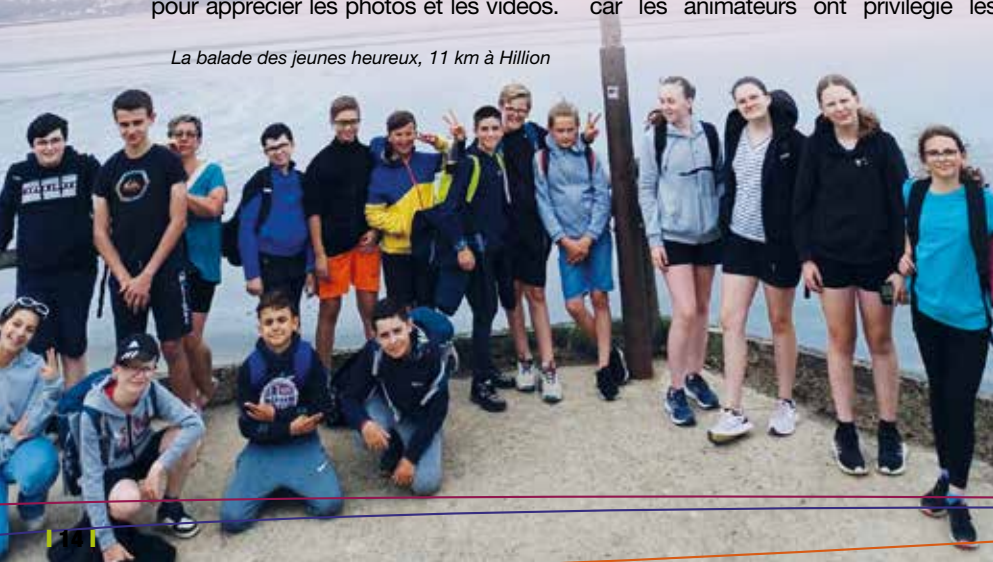
La balade des jeunes heureux, 11 km à Hillion

L'espace jeunes sera fermé pendant les vacances de Noël. 16 jeunes pourront profiter du séjour ski du 8 au 15 février 2025. 7 jeunes étaient sur la liste d'attente. Un partenariat avec la commune de Trémuson a été mis en place. Il est prévu un visionnage résumant le séjour à la salle des conseils du Foeil, le vendredi 7 mars 2025 à partir de 19h. Un programme d'activités sera proposé sur la 2 ème semaine des vacances de Février. Cela permettra à chacun de profiter des vacances d'hiver. A partir de janvier, il faudra remplir une nouvelle fiche de liaison et régler l'adhésion de 12€ pour les jeunes du Leslay et du Foeil ou 20€ l'année pour les jeunes qui ne font pas partie de la commune. Une fois que le jeune a réglé son adhésion, il peut profiter de tous les services proposés.