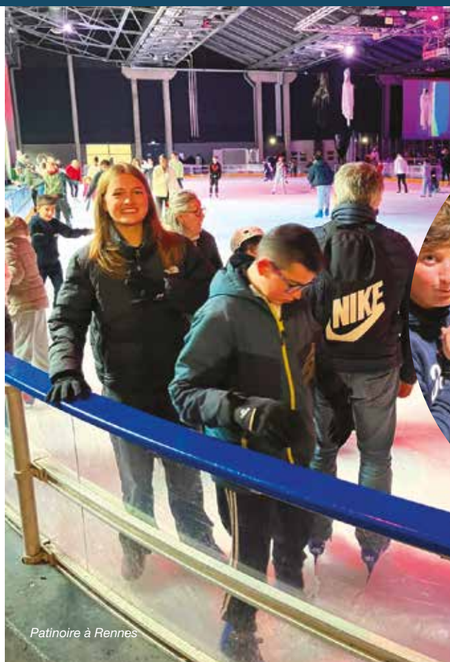
Patinoire à Rennes