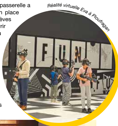
Réalité virtuelle Eva à Ploufragan