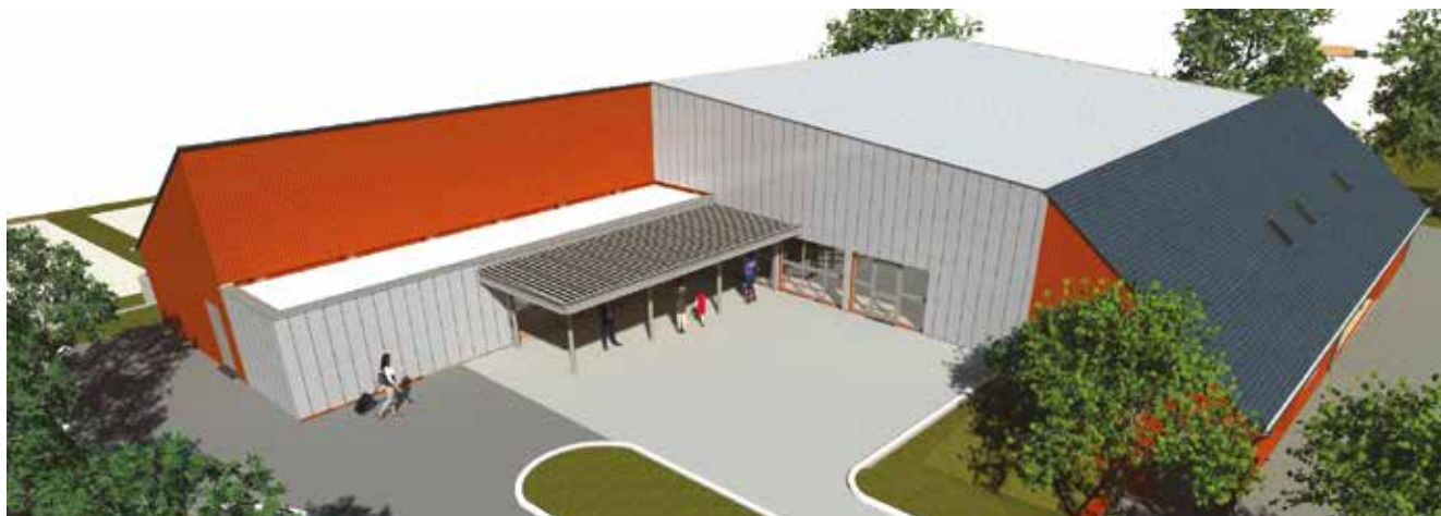
Vue aérienne de la salle suite aux travaux