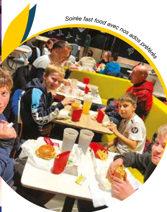
Soirée fast food avec nos ados préférés

Cette période confirme la place essentielle de l'Espace Jeunes dans la vie communale : un lieu où les adolescents peuvent s'exprimer, s'impliquer et développer leurs projets dans un cadre convivial et éducatif.