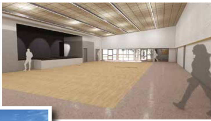
Vue intérieure de la salle suite aux travaux

Ce sont donc des travaux importants de rénovation de la salle polyvalente qui débutent à la fin de cette année 2025, à la fois sur les aspects intérieur et extérieur, sur le mode de chauffage, ainsi que sur une grande partie de la disposition de la salle. L'ensemble de ces travaux est prévu sur une période supérieure à une année, pour se terminer au printemps 2027.