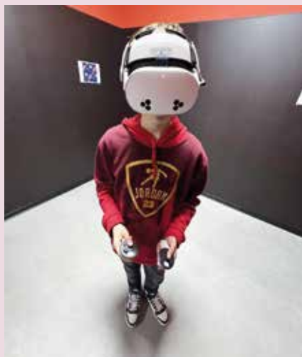
Louis fait un virtual room

Les vacances de printemps ont également été marquées par de nombreuses animations : escape game, réalité virtuelle, karting, ainsi que des rencontres entre jeunes avec Trémuson