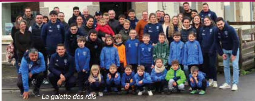
La galette des rois

En parallèle, notre équipe senior masculine en foot loisir à 11 sera également relancée, avec des matchs disputés le vendredi soir. L'objectif est de permettre à tous les passionnés, débutants ou anciens joueurs, de continuer à vivre leur passion sans pression, dans un cadre chaleureux.