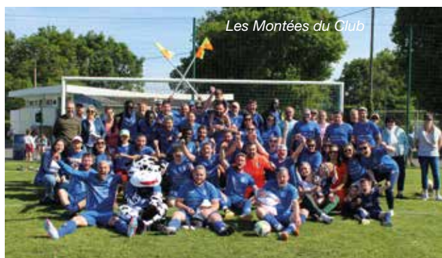
Les Montées du Club

> Vous souhaitez devenir partenaire du club ? Contactez-nous à : etslefoeil@gmail.com