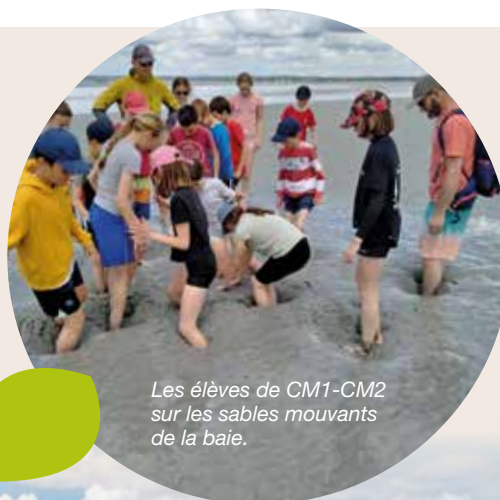
Les élèves de CM1-CM2 sur les sables mouvants de la baie.

La journée s'est très bien passée, une météo clémente et des mines réjouies.