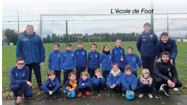
L'école de Foot

En vue de la saison 2025/2026, le club continue de se développer et d'ouvrir ses portes à de nouveaux profils. Nous avons le plaisir d'annoncer la relance de notre équipe senior féminine à 7, ouverte à toutes les joueuses à partir de 17 ans. Cette équipe évoluera en football loisir et jouera exclusivement le vendredi soir dans une ambiance conviviale et détendue.