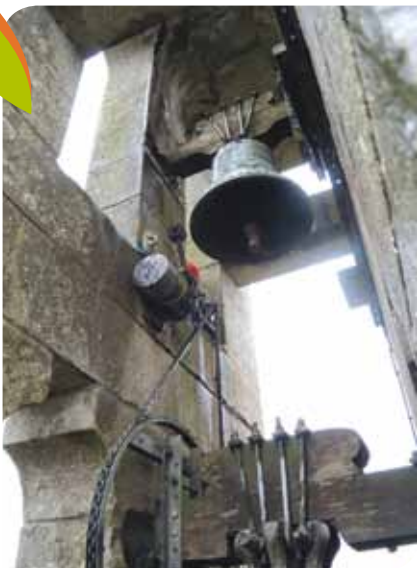
Le Fœil est un relais de la paroisse Notre Dame de Délivrance.